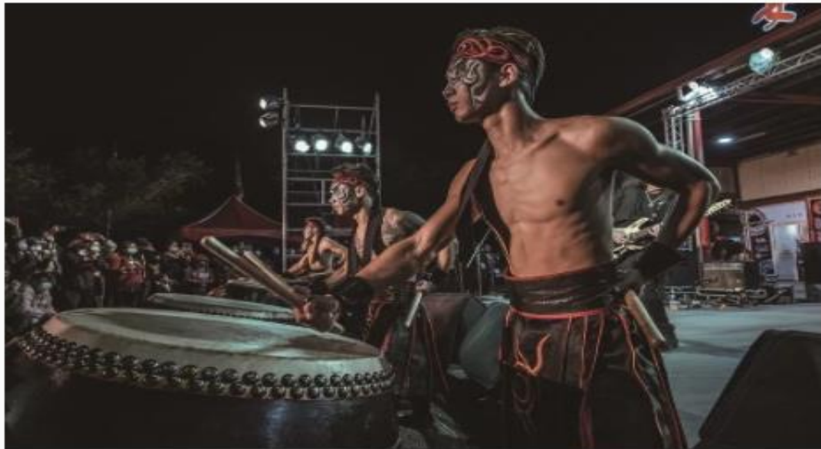
當搖滾精神碰撞感恩信仰，「鼓神祭」融合多元的跨界元素，即使不是信徒也會深受撼動。