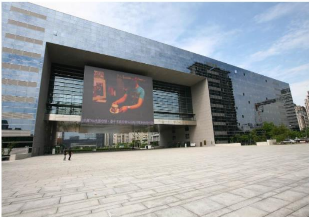
台中市府《台中市流行音樂產業活動行銷推廣補助辦法》的補助額，每件以50萬元為限。