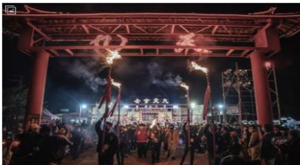
▲搖滾精神從搖滾感原信仰，「鼓神祭」融合多元的跨界元素，即使不是信徒也會深深感動。（圖

為打造台中市成為流行音樂友善之都，市府透過流行音樂補助、培育創作樂團、舉辦大型音樂活動等措施，全力支持音樂創作，扶植流行音樂產業，期望將音樂融入市民生活日常。台中市府自2018年起推動「台中市流行音樂產業活動行銷推廣補助辦法」，截至2021年5月，共補助33案，補助金額累計達910萬3,656元。補助活動類型多元，以2020年補助案分析，包括搖滾流行與傳統文化的跨界結合（鼓神祭）、獨立樂團（搖提）講座會結合專題攝影展、活化台中市Live house的尋場演出（台中嘻哈獨立樂團——西屯純聲組）、學生主導規劃的音樂祭，落實獨立音樂向校園扎根（中國醫藥大學——街角無聲音樂祭）等，藉此活絡台中音樂圈，帶動城市行銷與流行音樂產業。