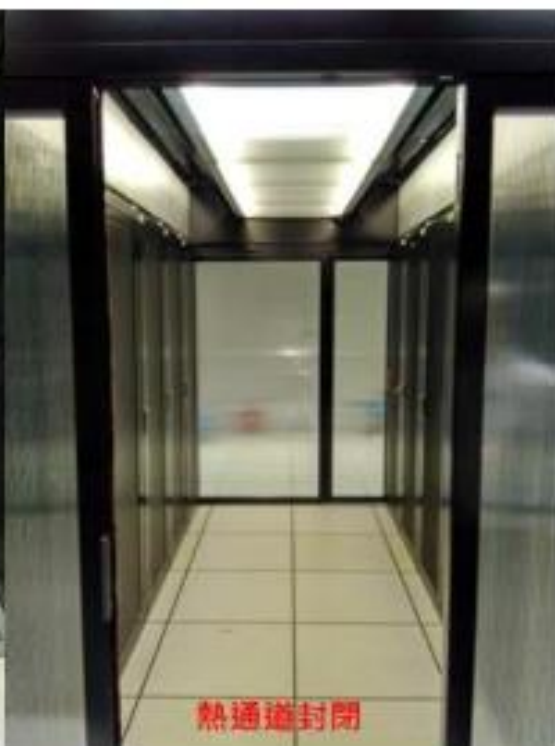
機房為下吹式冷房，各機櫃熱通道可封閉設計