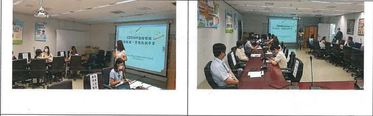
內容：課程海報或簡報首頁