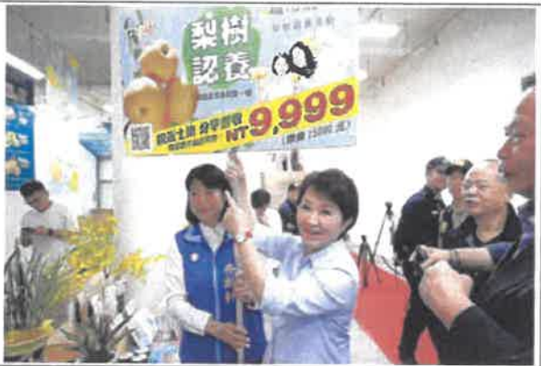
媽媽市長，農特產品行銷