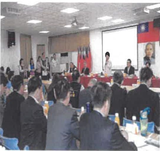
盧市長赴大里主持市政會議