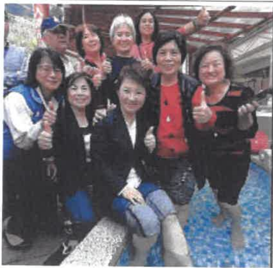
媽媽市長-墾立市府親民特質