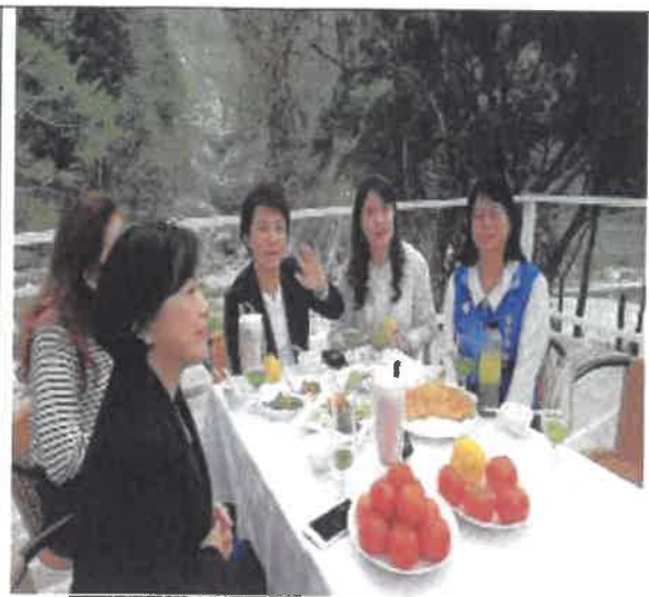
媽媽市長，農特產品行銷