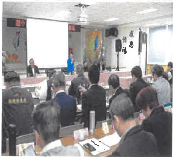
盧市長赴豐原主持市政會議