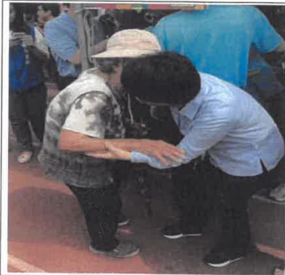
媽媽市長-墾立市府親民特質