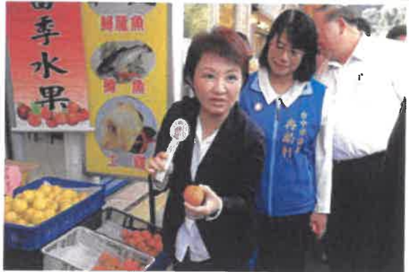
媽媽市長，農特產品行銷