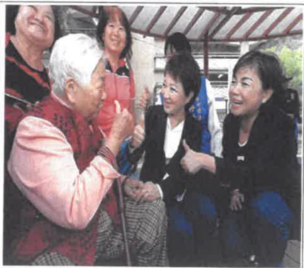
媽媽市長-墾立市府親民特質