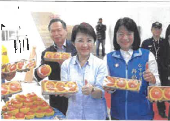
媽媽市長，農特產品行銷