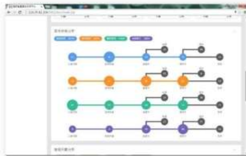
資訊圖表化-辦理狀態分析