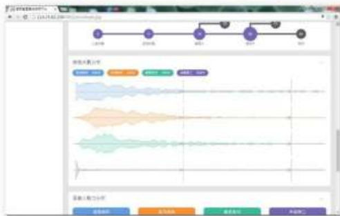
資訊圖表化-辦理天數分析