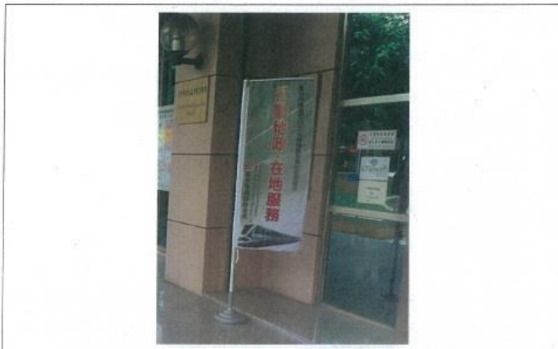
圖 1.北屯區公所駐點服務