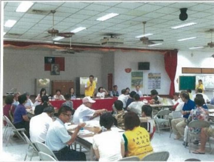
圖 1. 協調合併說明會情形