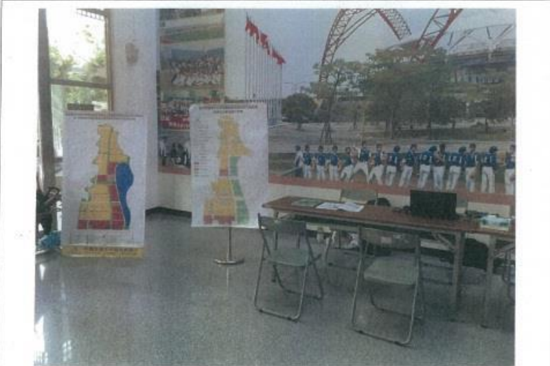
圖 2.北屯區公所駐點服務