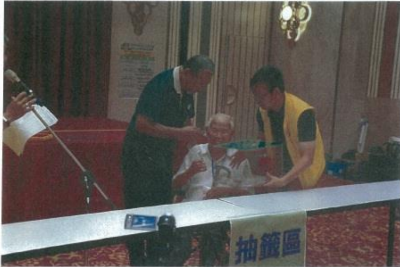
圖 1.抽籤戶行動不便之應變情形