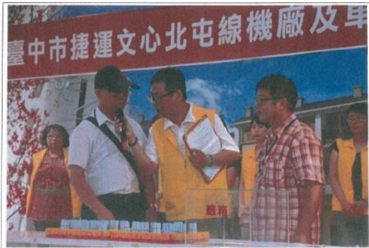
圖 3. 監籤人員確認簽票數量 2