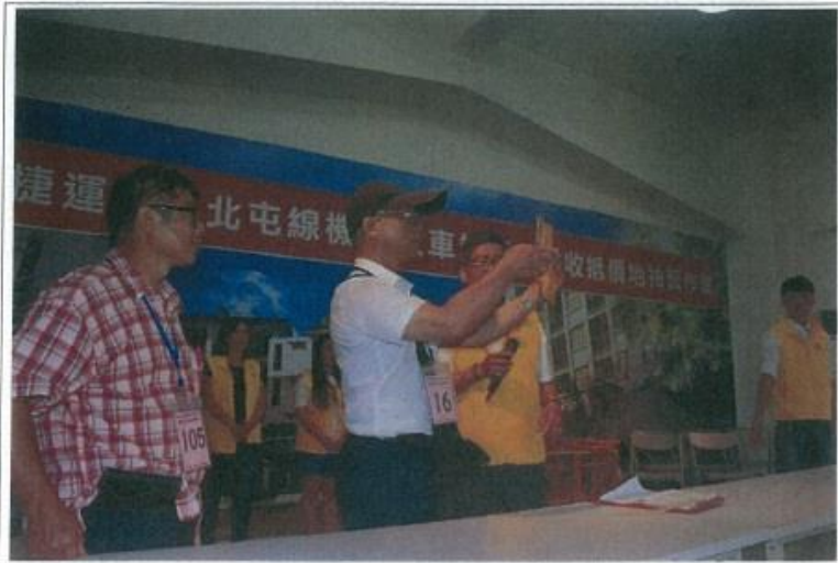
圖 1. 監籤人員查驗籤票密封情形