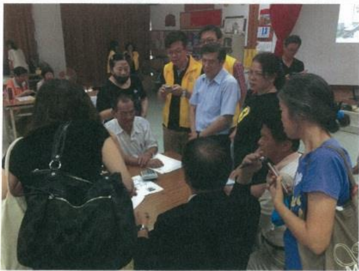
圖 2. 協調合併說明會情形