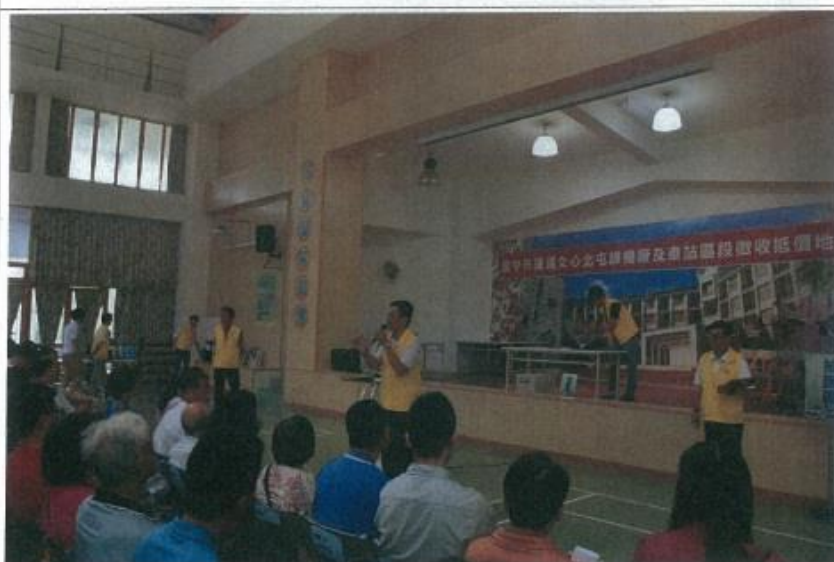
圖 2. 抵價地抽籤暨配地作業流程解說