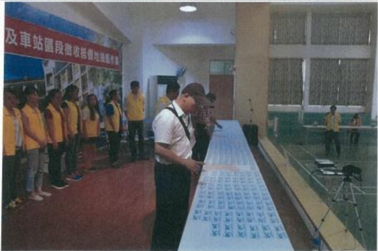
圖 2. 監籤人員確認籤票數量 1