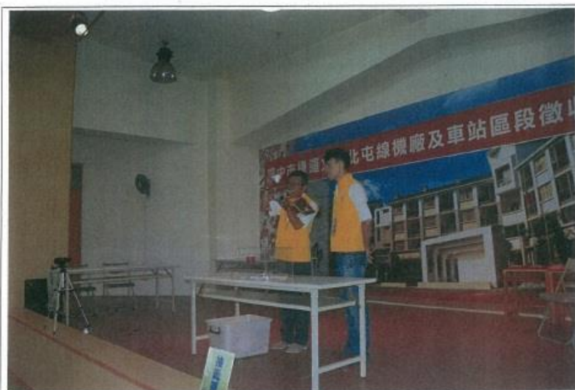
圖 1. 抵價地抽籤暨配地作業流程解說