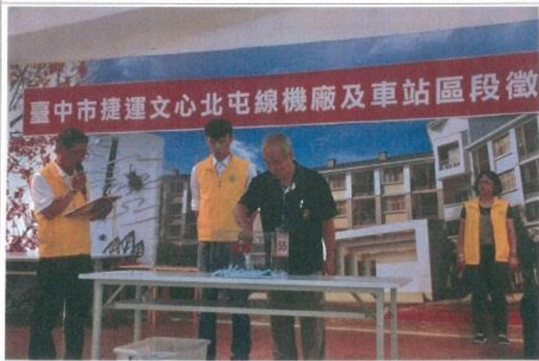
圖 4. 民眾公開抽籤透明情形