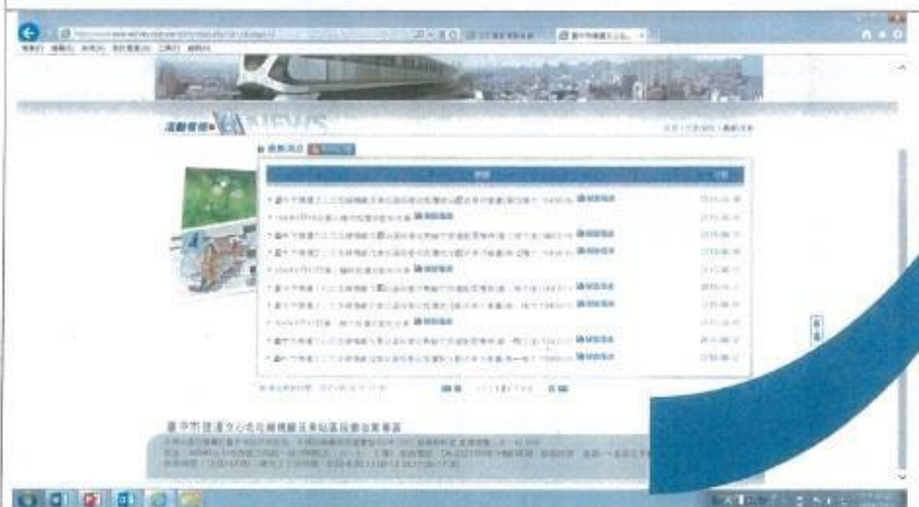
圖 2. 專區網站瀏覽成果