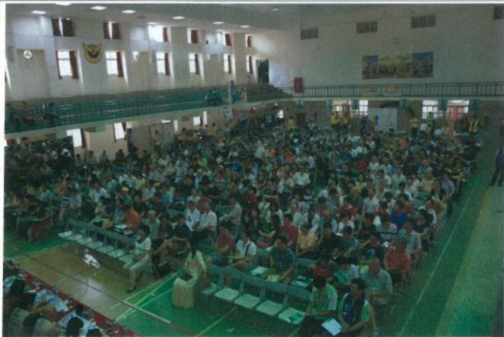
圖 2. 抵價地抽籤暨配地作業說明會