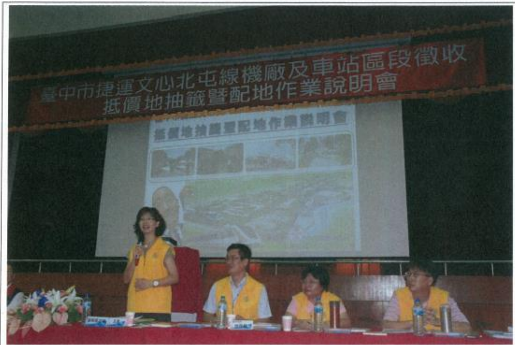
圖 1. 抵價地抽籤暨配地作業說明會