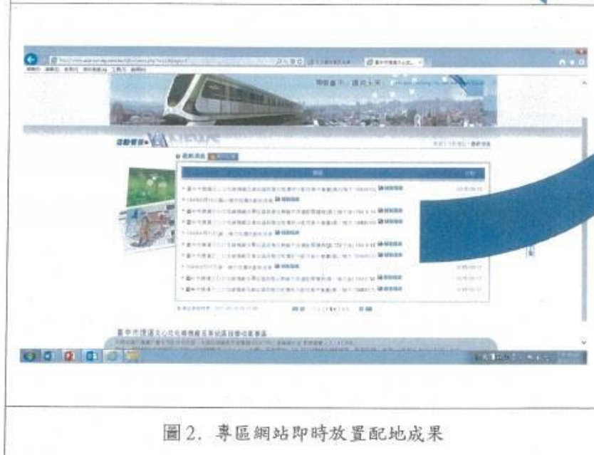
圖 1. 專區網站即時放置配地成果